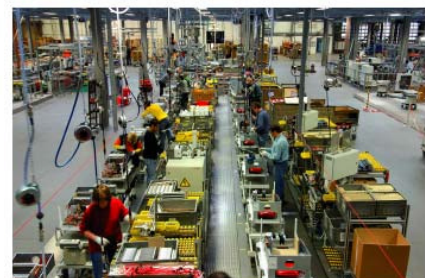
Виробництво в Німеччині, м. Аллендорф