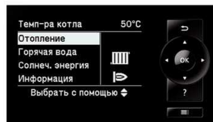
Новий регулятор Vitotronic